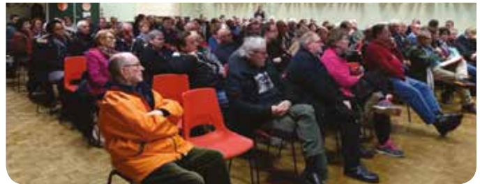
Théâtre suivi d'échanges avec les comédiens