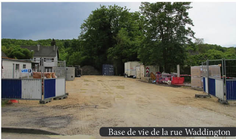
Base de vie de la rue Waddington

Les travaux dans les hameaux tiennent aussi les «phasages» prévus, seules quelques priorités d'interventions sur certaines voies ont été modifiées et interverties. Des réfections de bitume sont déjà effectuées sur les «tranchées» notamment rues Menoue, du Clos